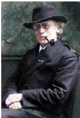
Fotografie kolorovaná za pomoci strojového učení

Zatím jsme se setkali pouze s pozitivními ohlasy od čtenářů. Doufáme, že tento experiment bude dobře fungovat.