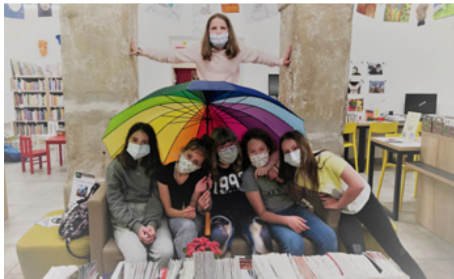
Čtenářský kroužek v KJM Medlánky