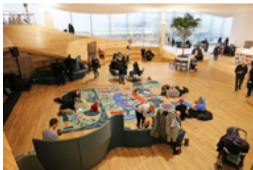
Centrální knihovna Oodi v Helsinkách, vstupní hala

knih ve volném výběru na 100 tisíc, aby tak mohl vzniknout kreativní prostor pro uživatele, ale i prostor pro kavárnu a restauraci ad. Avšak např. požadavek veřejnosti na saunu knihovníci odmítli. Jen v prvním roce provozu navštívilo knihovnu přes jeden milión