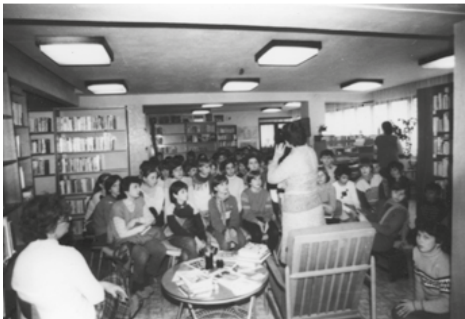
Besedy se spisovateli v kuřimské knihovně

Od 1. 1. 2008 se činnost knihovny rozšířila také o kulturní akce ve městě. Stávající kulturní dům na nám. Osvobození se stal součástí Městské knihovny a bylo zde vytvořeno nové oddělení kultury. Vzhledem ke stáří budovy se stále více