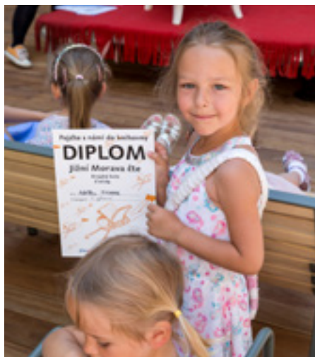
Slavnostní předání cen vítězům

Těšíme se na čtení v knihovnách, na všechny soutěžní práce a na brzké osobní setkání.