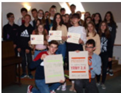
Autorské čtení v MK Znojmo

V letošním roce se MěK Znojmo zapojila do projektu Asociace spisovatelů, knihoven ČR,