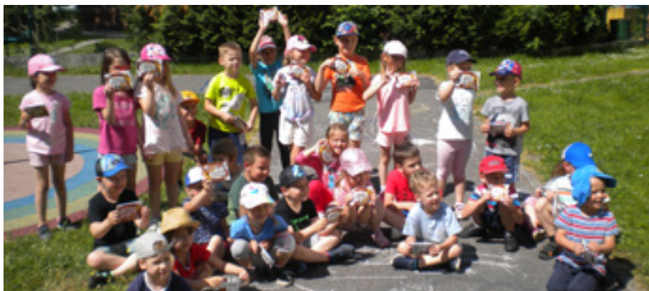
Účastníci Malování na chodníku

Děti byly špinavé od křídý na šatech, ve vlasech, po pusinkách, ale zářily spokojeností a nadšením. Tak ještě jednou: „ Našemu malování třikrát HURÁ “ a sejdeme se zase za rok za Městským domem kultury v Karviné.